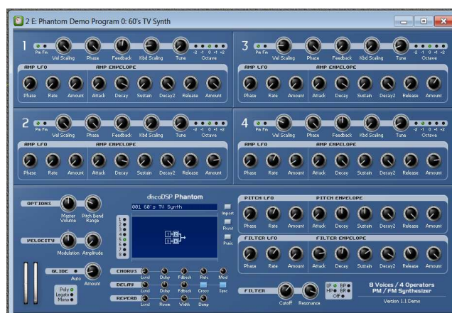
Syntezator Phantom oparty na metodzie FM